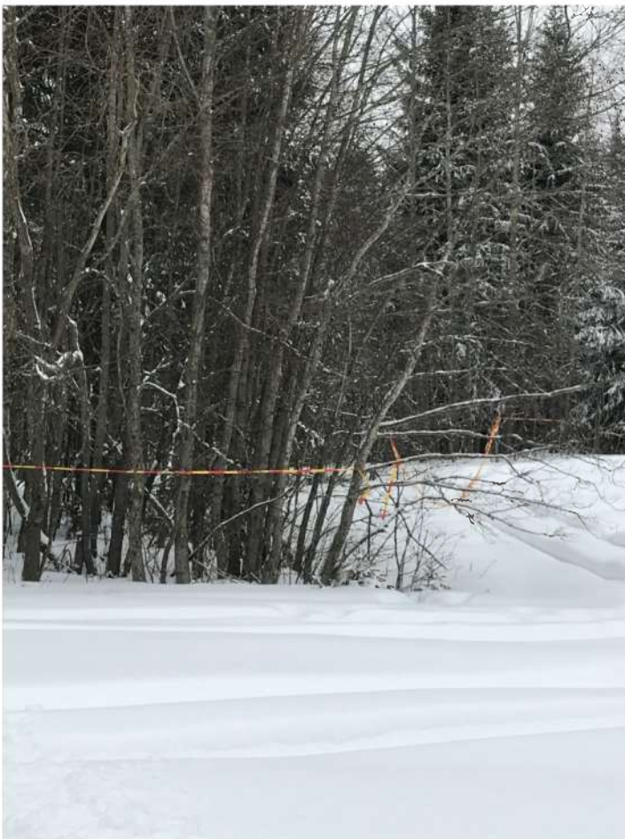
Bilde 3: Verne- og hensynssoner er markert i terrenget. Sperrebånd byttes ut med alpintgjerder når snøen er borte, og det har tørket opp.