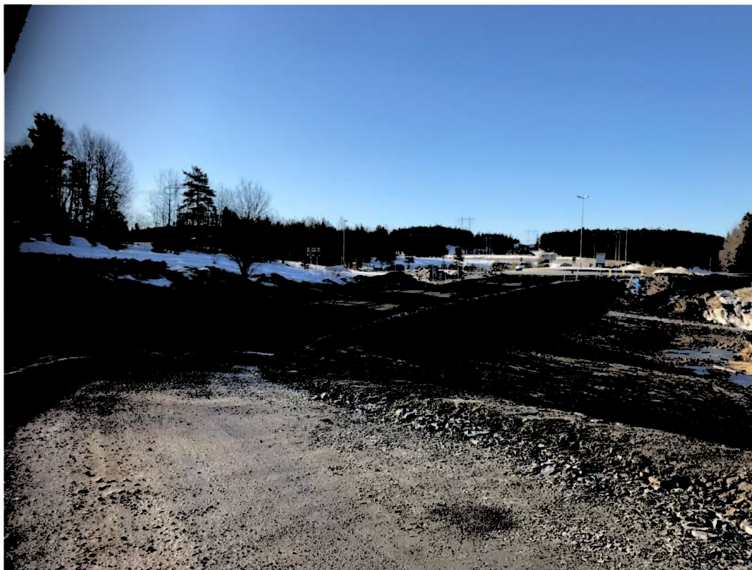
Bilde 1: Ny avkjøring fra rundkjøringen i Taraldrudkrysset er etablert

Miljøsanering og riving av boliger, samt sprengningsarbeider for byggegrop og VA-grøfter starter i april og pågår i hele fase 1.