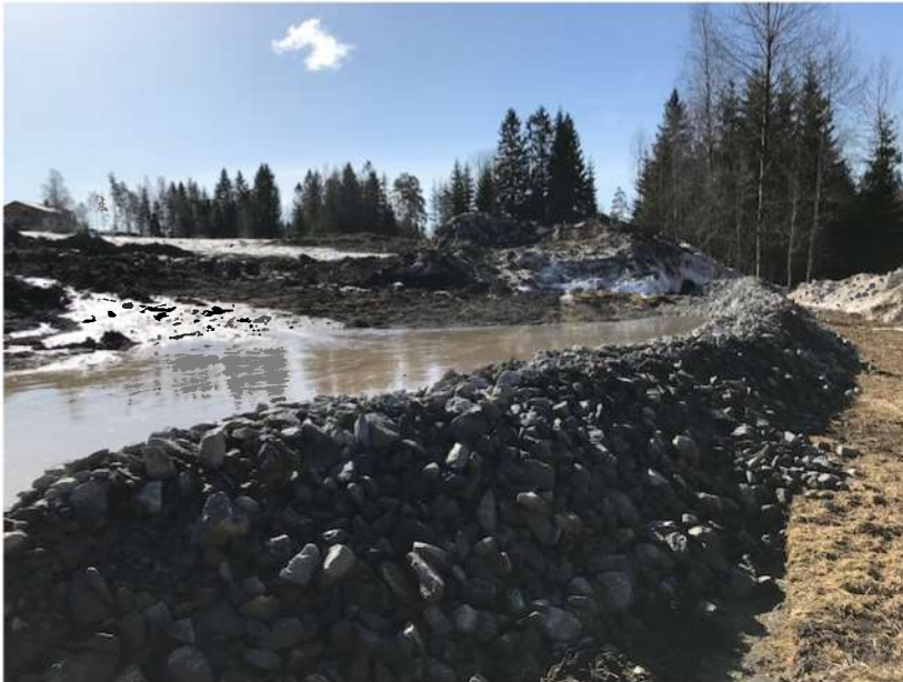
Bilde 2: Infiltrasjonsbasseng for rensing av overvann